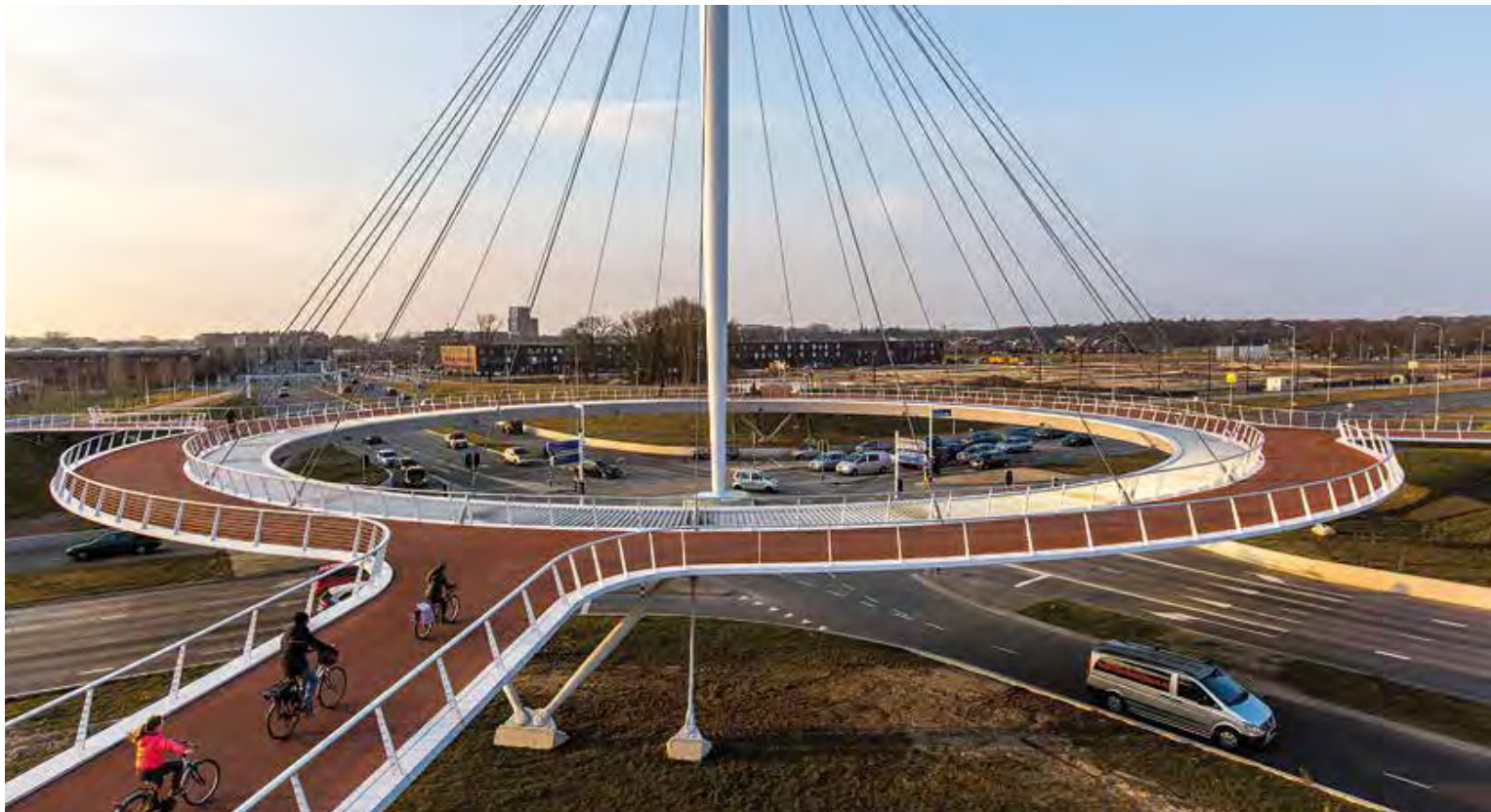
Ökonomisch: Großzügige Fahrradspuren wie der Hovenring in Eindhoven, den täglich bis zu 5000 Radler nutzen, schaffen Anreize, aufs Rad umzusteigen und damit den Treibstoffverbrauch und die Abgasemissionen zu verringern

erstellt hat und an deren Umsetzung arbeitet. Sie sehen unter anderem vor, die sogenannten ESG-Kriterien in die Investmentanalyse- und Entscheidungsfindungsprozesse einzubeziehen, wobei ESG die Bereiche Umwelt, Soziales und gute Unternehmensführung umfasst. Des Weiteren sollen Akzeptanz und Umsetzung der ESG-Grundsätze in der Investmentindustrie vorangetrieben, deren Effektivität gesteigert und transparent darüber berichtet werden. Darüber hinaus geht es um eine angemessene Offenlegung von ESG-Themen bei den Unternehmen, in die investiert wird, und nicht zuletzt auch darum, sich selbst ESG-konform zu verhalten.